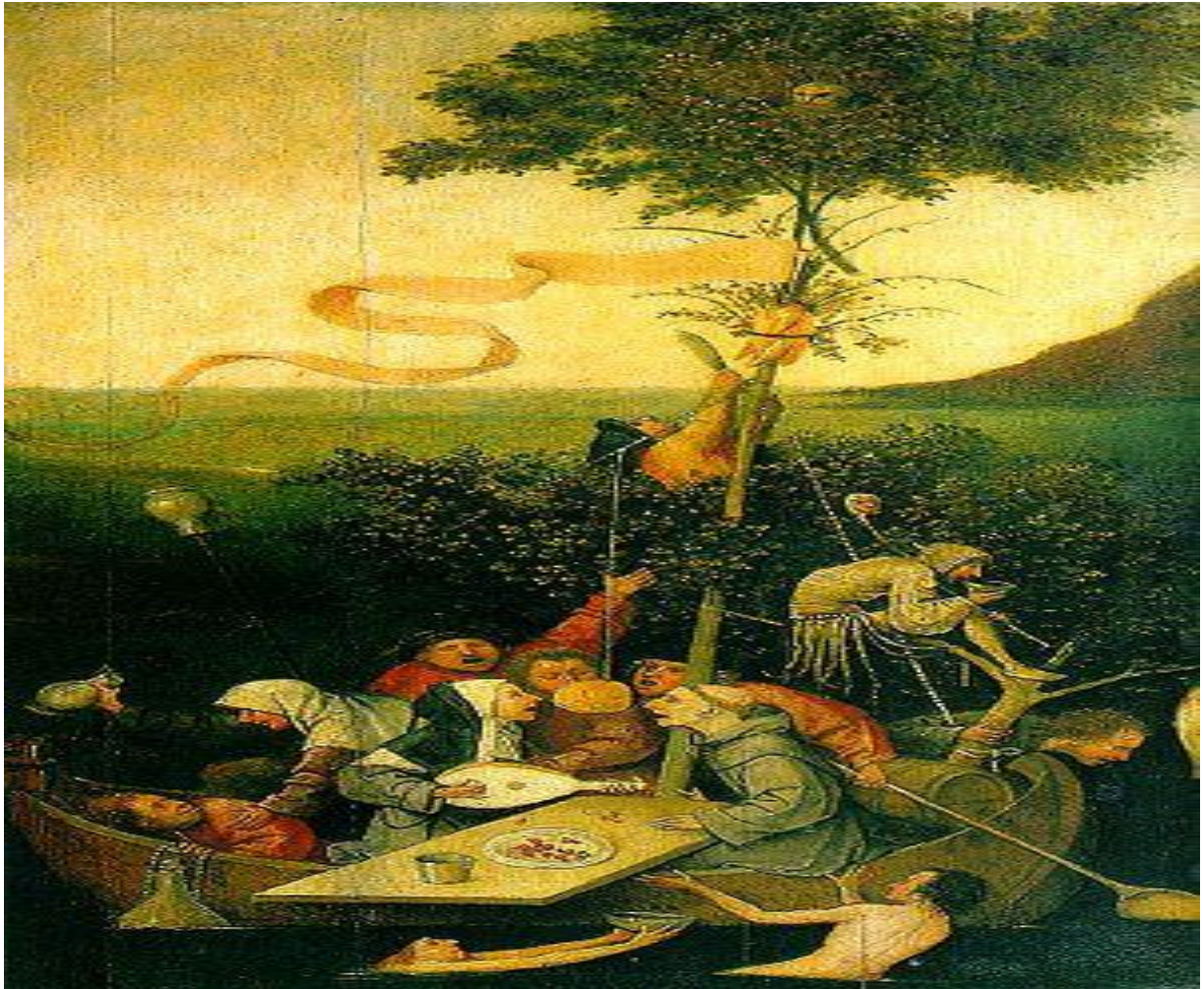
A nau dos loucos (1485-1500) Hieronymos Bosch (1450-1516). (Óleo sobre madeira. 55 X 31,5 cm) Museu do Louvre, Paris.

No quadro de Bosch vê-se um estranho barco tripulado por vários personagens. Na porção central da pintura encontram-se três religiosos (duas freiras e um monge) que se divertem em uma pequena festa junto com vários camponeses. O mastro do barco é uma árvore – segundo Foucault (1993, p. 21), trata-se da mesma árvore que outrora ocupou o centro do paraíso: a árvore proibida do conhecimento e do pecado – e numa das cordas hasteadas até o mastro está sentado um bobo, ou um bufão que representa a figura do louco. Nesta obra, Bosch alude à devassidão que atingia todos os grupos sociais de seu tempo; denuncia os vícios que marcam a sociedade em sua época e faz uma crítica direta ao comportamento do clero que está representado no centro da pintura. As freiras e o monge demonstram um total abandono de suas obrigações religiosas ao mesmo tempo em que se entregam aos prazeres e vícios mundanos. No canto esquerdo uma freira tenta surrupiar as joias de um camponês em uma alusão à usura e à ganância; no centro o monge e a freira (que aparece tocando um alaúde, instrumento