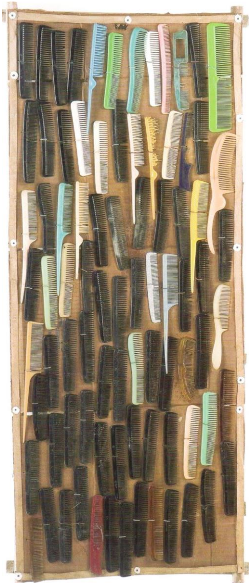
Pentes (s/ data). Arthur Bispo do Rosário (1909-1989). (Madeira, plástico, tecido e papel. 180 x 60 x 20 cm). Acervo: Museu Arthur Bispo do Rosário Arte Contemporânea, Rio de Janeiro. 19