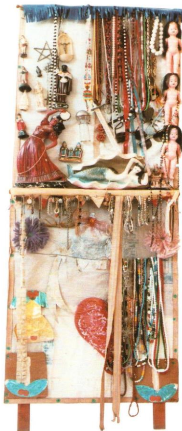
Macumba (s/ data). Arthur Bispo do Rosário (1909-1989). (Suporte de madeira, plástico e papelão. 193 x 71 cm). 4

Percebe-se, nesta peça, a existência de uma ideia central presente tanto na cultura ocidental medieval (de onde provém a inserção do cristianismo católico no Brasil) quanto nas culturas tribais africanas (que foram trazidas para o Brasil com a escravidão): a religiosidade. Mas a religiosidade representada aqui não se atém aos conhecidos conflitos históricos entre crenças, religiões e seus respectivos deuses e discursos, se mantém livre e não se prende às demarcações filosóficas e interpretativas que separam os credos e suas míticas narrativas. A religiosidade se atém, antes, ao puro sentimento de conexão do homem com esta força maior divina, não importando os meios utilizados por ele para se conectar com o divino, para representar o divino. Interessa a Arthur Bispo do Rosário dar forma a esta emoção que emerge da