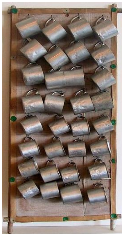
Canecas . (s/ data). Arthur Bispo do Rosário (1909-1989). (Canecas de alumínio em suporte de papelão. 110 x 47 cm). Acervo: Museu Arthur Bispo do Rosário Arte Contemporânea, Rio de Janeiro. 28

Porém, embora algumas obras de Bispo guardem semelhanças estilísticas com o novo realismo, não seria possível dizer que ele tenha sido adepto do novo realismo. Embora algumas obras de Bispo guardem semelhanças técnicas e visuais que, de certa forma, possam atribuir a ele uma mesma percepção e sensibilidade características dos artistas afeitos ao novo realismo, não seria possível dizer que compartilhasse dos mesmos ideais, ou dos mesmos objetivos que os artistas do movimento europeu.