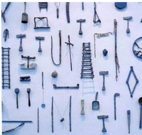
ORFAs (s/ data). Arthur Bispo do Rosário (1909-1989). (Objetos Recobertos por Fios Azuis). Acervo: Museu Arthur Bispo do Rosário Arte Contemporânea, Rio de Janeiro. 42

na qual se encontram; agora fazem parte da reconstrução do mundo, fazem parte de uma nova cosmogonia.