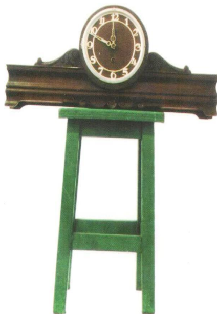
Carrilhão (s/ data). Arthur Bispo do Rosário (1909-1989). (Relógio carrilhão de mesa, fora de funcionamento. 12 x 63 x 10 cm.) 13