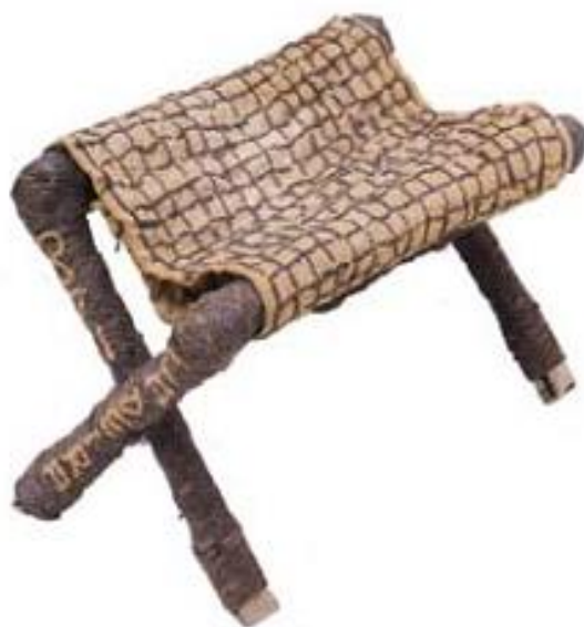
ORFAs (s/ data). Arthur Bispo do Rosário (1909-1989). (Objetos Recobertos por Fios Azuis). Acervo: Museu Arthur Bispo do Rosário Arte Contemporânea, Rio de Janeiro. 43