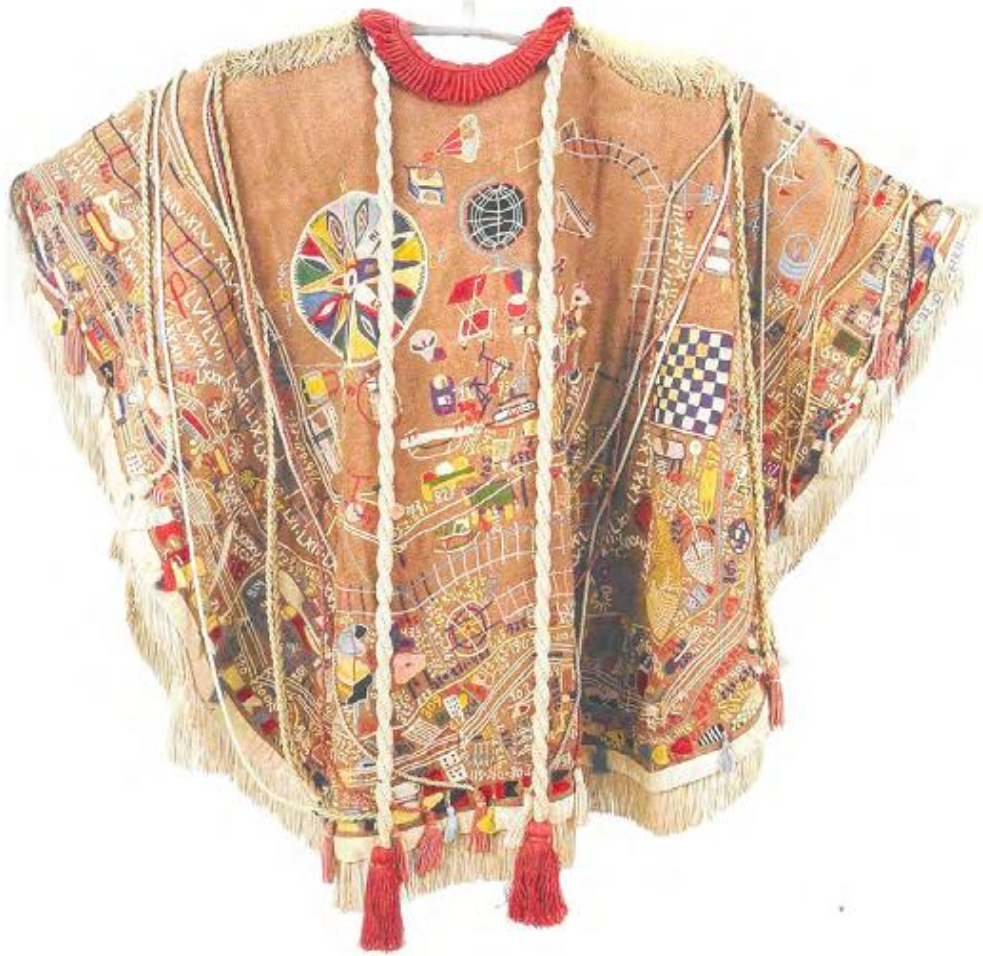
Manto da Apresentação (s/ data). Arthur Bispo do Rosário (1909-1989). (Costas. Tecido, linha, papel e metal. 118,5 x 141,2 cm). Acervo: Museu Arthur Bispo do Rosário Arte Contemporânea, Rio de Janeiro. 40

O manto da apresentação concentra os significados de cosmogonia e escatologia que, embora distanciados por um andamento temporal progressivo que os distingue em início e fim, permanecem próximos no sentido de que um será sempre uma espécie de prelúdio do outro.