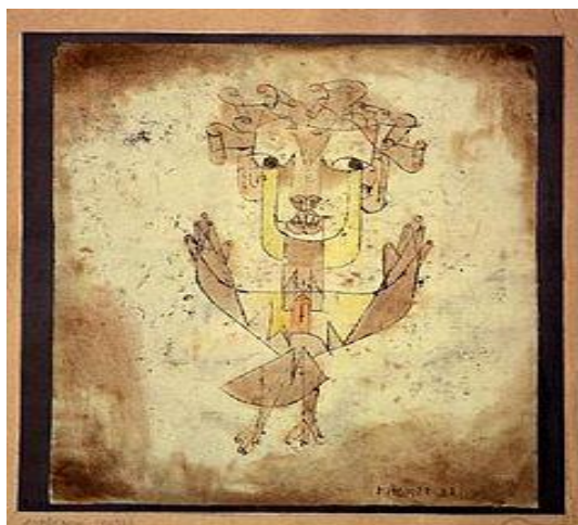
Angelus Novus (1920). Paul Klee (1879-1940). (Nanquim, giz pastel e aquarela sobre papel). Museu de Israel, Jerusalém.

Esta enigmática pintura feita com aquarela ácida e ponta seca de pincel tornou-se muito conhecida e causou (e causa ainda hoje) inquietações a filósofos, artistas e historiadores; mas é possível que parte do reconhecimento e projeção alcançada pela obra de Klee se deva ao fato de ter chamado tanto a atenção de Walter Benjamin cuja leitura deste quadro se tornou tão conhecida quanto o próprio quadro. Diz o autor sobre a pintura: