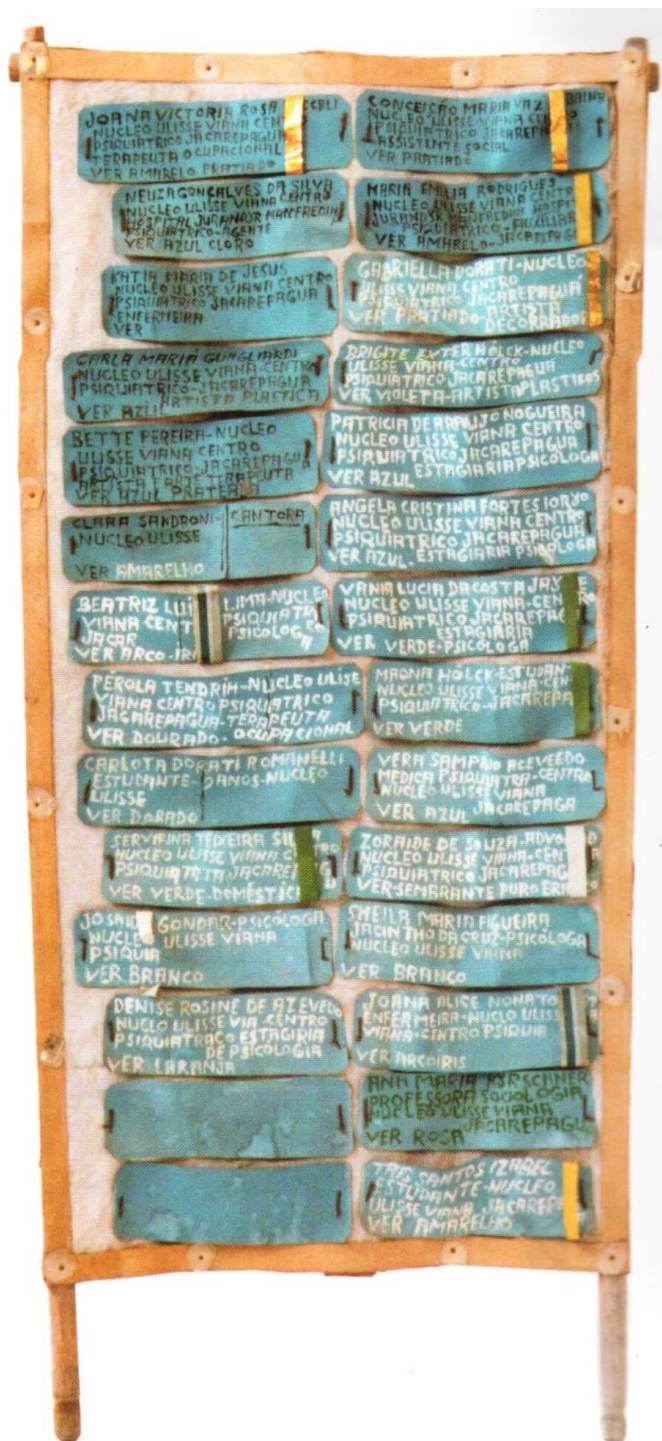
Vitrine-fichário. (s/ data).