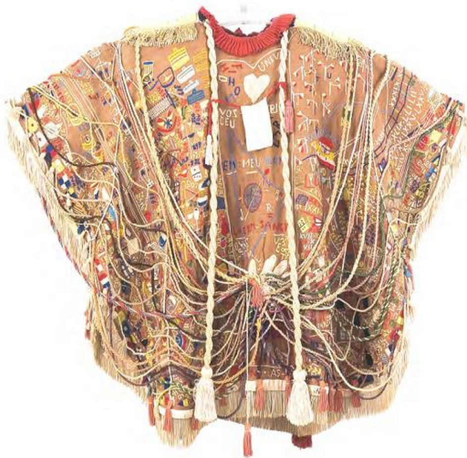
Manto da Apresentação (s/ data). Arthur Bispo do Rosário (1909-1989). (Frente. Tecido, linha, papel e metal. 118,5 x 141,2 cm). Acervo: Museu Arthur Bispo do Rosário Arte Contemporânea, Rio de Janeiro. 39