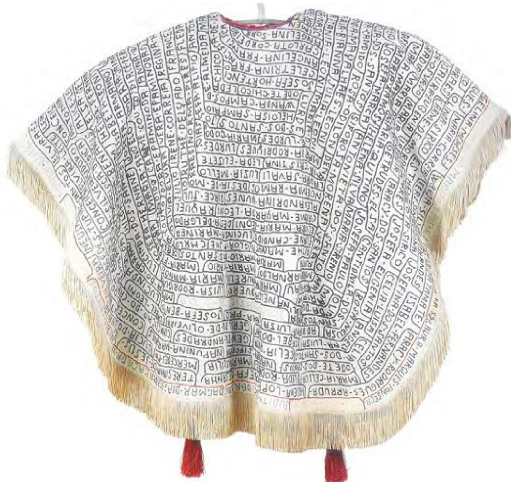
Manto da Apresentação (s/ data). Arthur Bispo do Rosário (1909-1989). (Averso frente. Tecido, linha, papel e metal. 118,5 x 141,2 cm). Acervo: Museu Arthur Bispo do Rosário Arte Contemporânea, Rio de Janeiro. 41

É interessante comentar a escolha das cores que predominam nesta parte interna do manto: o azul e o branco. Cores que, lidas em conjunto ou isoladamente, trazem significações simbólicas. Juntas, remetem às cores do céu que, em praticamente todas as mitologias, é o lugar da morada dos deuses, dos anjos, o lugar que algumas religiões tomam como paraíso, no universo católico estabelece oposição imediata com o seu contrário, o inferno; portanto cores que remetem a um significado bastante mítico e religioso. Mas dentro desta narrativa, o branco pode assumir o significado da pureza deste novo mundo que surge, a perfeição deste novo princípio imaculado gerado a partir da destruição total do velho mundo que se constituía degenerado, fraco