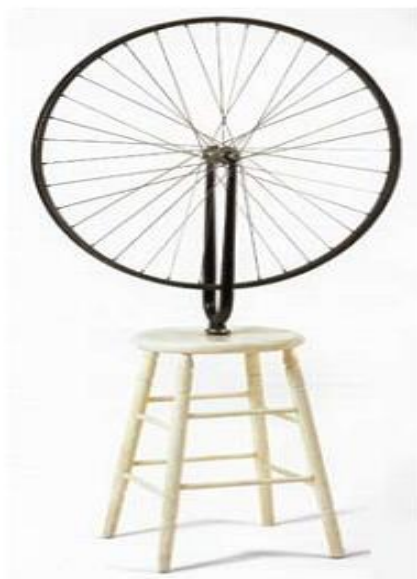
Roda de Bicicleta (1913). Marcel Duchamp (1887-1968). (Madeira, plástico, linha Metal). Museu de Arte Moderna de Nova York.

partir dos objetivos deste discurso. “Roda da Fortuna” não foi uma nomeação dada por Bispo, mas pelos catalogadores de sua obra que poderiam, no ato desta nomeação, aproximar ainda mais Bispo de Duchamp, posto que a semelhança estilística desta obra específica é realmente notável.