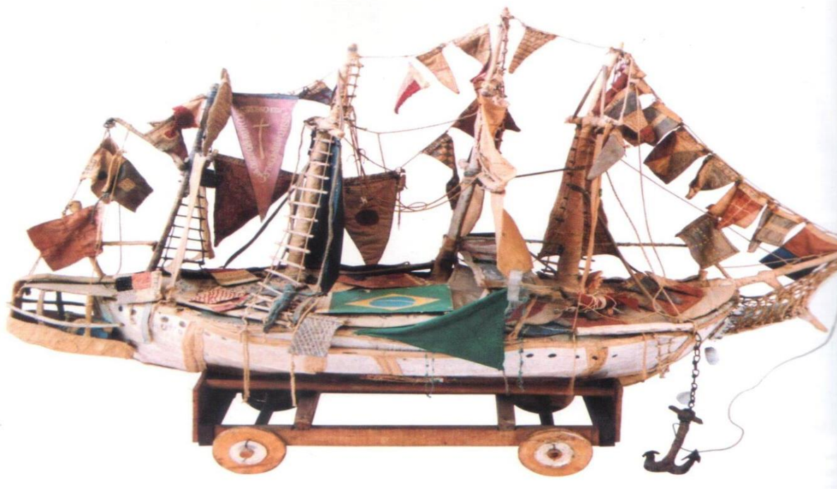
Grande Veleiro (s/ data). Arthur Bispo do Rosário (1909-1989). (Tecido algodão, tecido lã, madeira, linha, papelão, plástico, tinta PVA, metal. 150 x 60 cm). Acervo: Museu Arthur Bispo do Rosário Arte Contemporânea, Rio de Janeiro. 6

O barco é, por excelência, o instrumento do viajante que escolhe (ou é impelido a) se deslocar através das águas; sua figura pode ser associada com a travessia ou, mais especificamente, com a viagem. Há, no olhar do viajante, sempre uma chama de fascínio pelo desconhecido que está além da linha do horizonte, uma sede de experiência movida pelo mistério existente no limite que se nega a revelar-se, mas principalmente, há uma certeza vaga e imprecisa da existência de um “outro lado”, de uma “outra margem” a partir da qual seja possível uma continuidade que está para além daquilo que lhe é conhecido, ou seja, existe a esperança de um continuum a partir da outra margem.