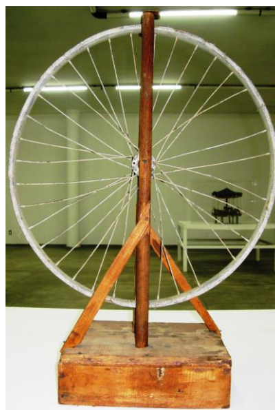
Roda da Fortuna (s/ data). Arthur Bispo do Rosário (1909-1989). (Madeira, plástico, PVA, metal. 67 x 29 x 51 cm). Acervo: Museu Arthur Bispo do Rosário Arte Contemporânea, Rio de Janeiro.

Esta parece ter sido uma das muitas formas de construir o Bispo artista através do discurso, ou seja, utilizar-se das características de um momento da historiografia da arte e absorver Bispo e sua obra para este momento específico através de comparações que auxiliem cada vez mais em sua percepção como artista e de sua obra como arte; ao mesmo tempo, tal estratégia discursiva constrói um distanciamento da imagem do doente mental e da obra como mero sintoma psiquiátrico.