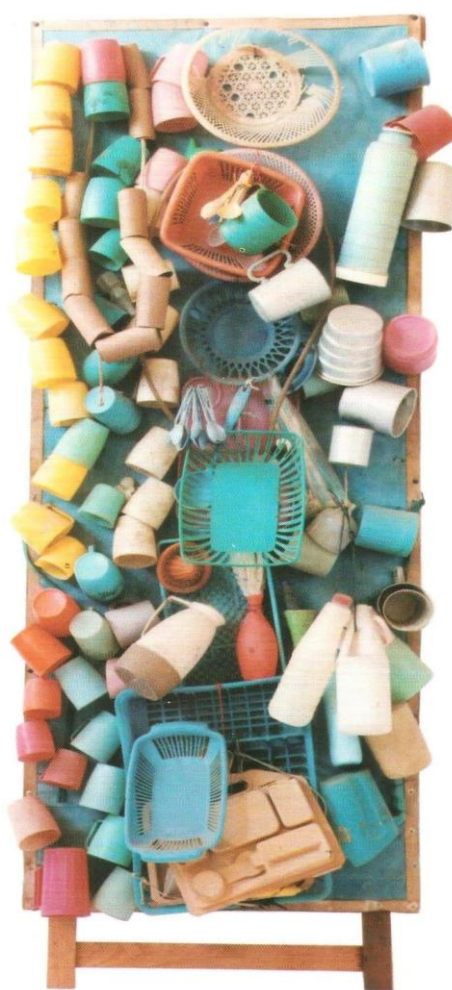
Cestas e canecas coloridas (s/ data). Arthur Bispo do Rosário (1909-1989). (Suporte de madeira e papelão, 197 x 70 cm). Acervo: Museu Arthur Bispo do Rosário Arte Contemporânea, Rio de Janeiro. 11

Nesta concepção de “recriar”, Bispo não parece estar buscando a totalidade do mundo para representá-la, mas apenas as coisas materiais, ou abstratas, que, a seus olhos, parecem interessantes e dignas de representarem os traços da existência humana na terra, dignas de constarem em seu cosmo pessoal. Deste modo, apenas aquilo que lhe impressiona enquanto belo e bom é recolhido para construir este mundo outro no qual habitará a humanidade após o juízo final.