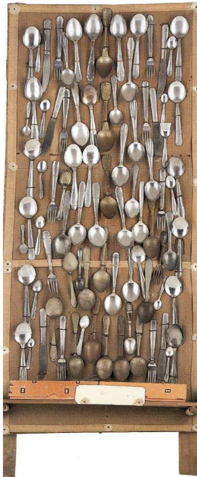
Talheres (s/ data). Arthur Bispo do Rosário (1909-1989). (Madeira, plástico, tecidos, papel e metal. 197 x 70 x 9 cm). Acervo: Museu Arthur Bispo do Rosário Arte Contemporânea, Rio de Janeiro. 54